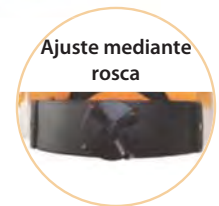
Ajuste mediante rosca