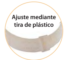
Ajuste mediante tira de plástico